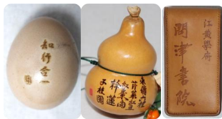
图 2-9 作者烙画作品文字展示

文字属于问津书院文化视觉元素系统的一部分，它对作品的文化层次加以充实、对于主题的辨识度起着加强的作用，并且和建筑、人物元素形成互补，从而达到烙画作品文化表现力的完备性。文字元素选取以问津书院有关儒家经典名句、书院匾额题字、文脉题记为主，主要选取“问津求道”“知行合一”“格物致知”等契合书院精神的短句，以及“问津书院”“江黄学府”等专属题字，字体结合烙画古朴质感和载体特点，分别选用行书、篆书，篆书体现庄重古朴，行书畅行，错落点缀在作品空白处，既不单调又深文化内涵。