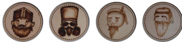
图 2-7 作者 Q 版人物杯垫展示

这些皮质设计既保留了烙画艺术的独特肌理与温度，又通过 Q 版人物的萌趣形象增强了亲和力，使得书院文化以更贴近日常生活的方式融入大众。而皮质杯垫上的 Q 版人物，更是将“知行合一”等思想可视化的动作浓缩其中，如王阳明墨貂貂皮大衣反差感，朱熹教学疲惫的愣神神情，都在方寸之间得到巧妙展现，让使用者在日常品茗时也能感知到问津书院的人文气息，实现了文化传播的潜移默化。