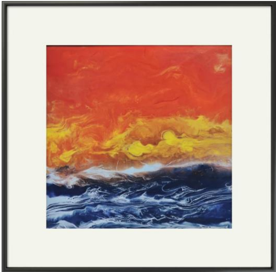
图2 《星辰大海》余饶生

运用不同的工艺手法可以制作出不同肌理效果,使得作品的艺术形式更加有感染力。瓷画的肌理元素展现出比其他绘画艺术更为庞大的表现语言,是一种有意味,能够打动人的艺术元素 [4] 。