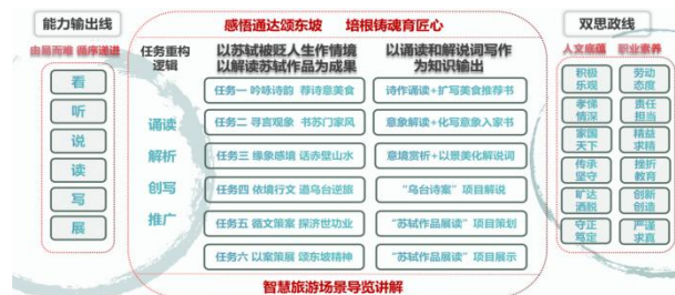
图1：情景化课程内容

创设教学情境能有效促进学生思考、分析问题，培养学习感知力，激发思维和兴趣，提升语言感知能力。在语感教学单元设计中，结合旅游服务与管理专业要求及云展览、云旅游新业态，将课程内容与智慧导览讲解等职业场景结合，以培养学生“诵读、解析、创写、推广”的语文核心能力为目标，选取苏轼被贬生涯为情境设计读写任务，使学生通过项目探索掌握朗诵、品读、写作等技巧和综合能力。