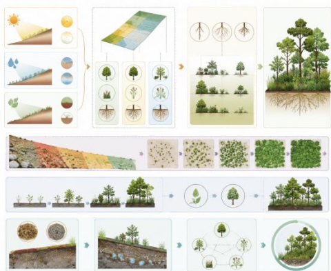
图1 耐候性植被群落筛选与配置结构示意图