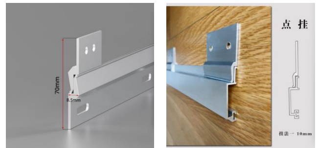
图 5、图 6 Z 形金属挂件

装配式安装工艺饰面材料（木饰面、硬包）通过金属挂件与副龙骨连接，目前常见的连金属接件为 Z 型金属挂件（详见图 5、图 6）。通常金属挂件与饰面材料通过金属螺丝连接，饰面基材要选择厚度在 8mm 以上，且可卧钉的板材。选择螺栓时，要根据饰面材料的基材强度、板厚等，确定螺栓的种类和长度，确保安装牢固，不破坏饰面材料。随着不断创新，更多可供选择的连接方式会越来越丰富、多样。