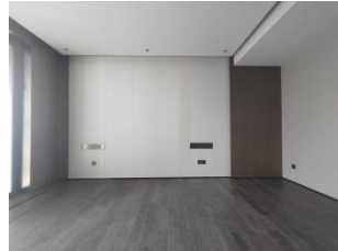
图 2 床背景硬包