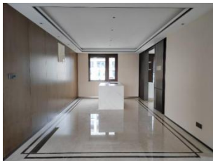
图 1 客厅木饰面

本项目属于高端住宅楼项目，由我司全系团队打造的空中别墅，设计、采购、施工一体化项目。共 20 栋住宅楼，施工面积约 69212.83m 2 ，共有 A、B、C、D 四个户型。该项目墙面大量采用木饰面、墙纸硬包、金属饰面板的装饰材料，每个户型施工工艺及饰面尺寸可复制性强、工程量大，适用于装配化施工。特此，我们做了木饰面、硬包装配化安装工艺的进行深化设计、方案的论证，并通过施工现场制作实体样板，验证了装配化安装工艺的可行性。