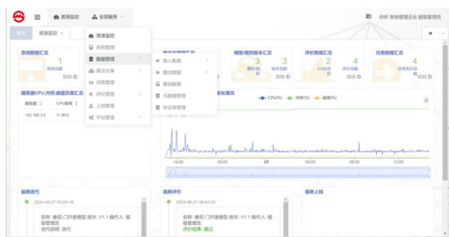
图4 车辆算法平台用户界面