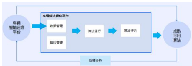
图 1 车辆智能运维平台和车辆算法孵化平台关系图

车辆算法孵化管理平台围绕“数据管理—算法导入—算法测试—评价验证—迭代/上线应用”的全流程构建闭环管理链路。车辆智能运维平台可向车辆算法孵化管理平台提供列车真实的运行数据和故障数据 [3] ，作为测试数据对算法进行测试，通过算法评价筛选出成熟可用的算法应用于车辆智能平台，图 1 为车辆智能运维平台和车辆算法孵化平台关系。