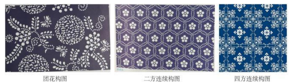
图3 桐乡蓝印花布纹样典型构图形式展示

桐乡蓝印花布纹样的构图遵循均衡与对称的设计原则,以中轴线为基准实现画面的对称均衡,契合民间大众追求圆满、规整的审美心理。整个画面主次分明、留白合理,有效把控了和谐的视觉节奏。该纹样独特的构图章法(如团花“么么”“么二”章法 [3] )与二方、四方连续构图,既适配传统布艺的装饰需求,也为其现代构图创新提供了重要的改造基础,见图3。