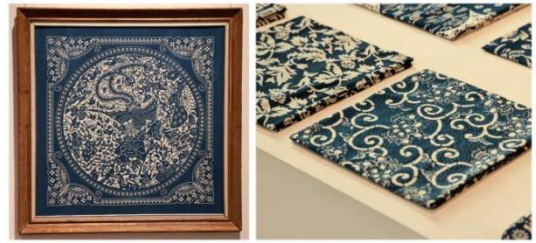
图2 桐乡蓝印花布蓝白二元色彩展示

添了自然的视觉层次,彰显了手工技艺的独特审美价值。蓝白配色既体现江南水乡的温润气质,又彰显东方简约美学特征,见图2。