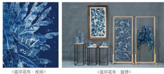
图4 哀警卫团队蓝印花布纹样创新作品展示

国家级非遗传承人哀警卫团队,是桐乡蓝印花布纹样现代创新的典范,其作品《蓝印花布·夜雨》《旋律》等,见图4,提取江南自然元素核心视觉符号,通过简化线条、优化造型转化为现代视觉图形,打破传统对称构图,融入现代留白,坚守蓝白核心色系,兼具传统韵味与现代气息 [5] 。团队将创新纹样应用于服饰、文创等多元产品,通过线上线下渠道推广,实现传统纹样活态传承。